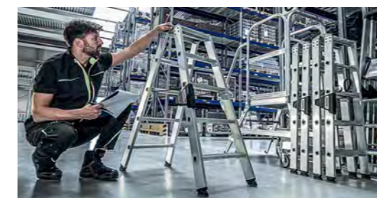
Prüfung und Wartung von Expertenhand.

Um diesem Anspruch zu genügen legt MUNK Service höchste Maßstäbe an sich selbst. So sind unsere Servicetechniker perfekt ausgebildete Experten, die ihr Handwerk in der Steig- und Rettungstechnik bei MUNK von der Pike auf gelernt haben. Um Ihre Anforderungen und Aufgaben vor Ort kompetent zu erfassen und schnell, präzise und zuverlässig zu lösen. Dabei legen wir größten Wert auf die individuelle und persönliche Betreuung. Um Dienstleistungen und Serviceangebote maßzuschneidern. Von der professionellen Montage, über die schnelle und wirtschaftliche Reparatur und Ersatzteilanfrage, bis hin zu passenden Maintenance- und Schulungskonzepten.