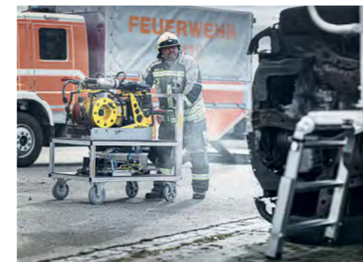
Wir bieten im Bereich Rettungstechnik ein umfassendes Sortiment an Rollcontainer-Lösungen.

Das ist unser Auftrag. MUNK Rettungstechnik übernimmt hier nachhaltig Verantwortung. Und setzt mit seiner perfekt auf den Einsatzzweck abgestimmten Steigtechnik- und Transportlogistik Maßstäbe in der Branche. Mit fortschrittlichen, cleveren und professionellen Lösungen, die vielfach bewährt sind. Für das entscheidende Plus an Sicherheit – gerade für Menschen, die sich auch unter härtesten Einsatzbedingungen bedingungslos auf die Qualität ihres Materials verlassen müssen.