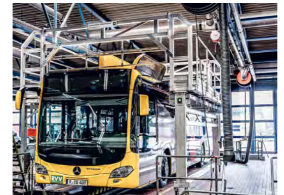
Schnelle, effiziente und sichere Reparatur und Wartung von Nutz- und Schienenfahrzeugen.

Produkte, die unsere Werkshallen verlassen, sollen Menschen langfristig verlässlich begleiten – im besten Fall ein Leben lang. Und das unterstreichen wir mit einem in der Branche einzigartigen Garantieverprechen von 15 Jahren auf das komplette Sortiment made in Germany. Gefertigt an unseren Standorten im Heimatlandkreis Günzburg, Deutschland.