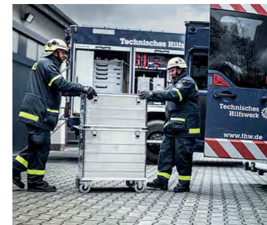
Stapelbare und robuste Transportkisten machen die Arbeit effektiver, ergonomischer und sicherer.

Ein Bereich, in dem die Qualität der Ausrüstung über ein Menschenleben entscheiden kann. Deshalb arbeiten wir in der Produktentwicklung gemeinsam mit den Einsatzkräften kontinuierlich an innovativen Lösungen. Damit im Ernstfall jeder Handgriff sitzt. Und das unterstreichen wir mit einem für die Rettungstechnik umfassenden Programm. Von Multifunktions-, Steck- und Seilzugleitern, über einsatzspezifische Rettungsplattformen und Werkzeugkästen, bis hin zum größten Sortiment an Rollcontainer-Lösungen. Begleitet durch ein breit gefächertes Beratungs-, Service- und Schulungsprogramm.