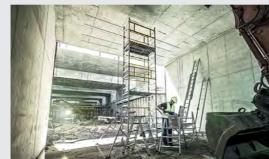
Kompromisslose Qualität – geschaffen für den Einsatz unter härtesten Bedingungen.

Unseren extrem hohen Anspruch an die Qualität unserer Produkte, Lösungen und Dienstleistungen fühlen Sie in jedem Detail. Und weil das so ist, garantieren wir Ihnen das. Mit nachhaltiger und schneller Ersatzteilversorgung und einer in der Branche einzigartigen Garantie von 15 Jahren auf alle unsere Serienprodukte made in Germany.