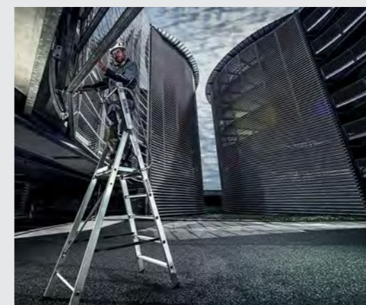
Große Standflächen, wie bei MUNK Plattformleitern, bieten Sicherheit auf höchstem Niveau.

Mit MUNK Produkten gestalten Sie sichere und effiziente Arbeitsbereiche nach Ihren Branchenanforderungen oder individuellen Wünschen. Ob Handwerk, Industrie, öffentliche Hand, Rettungstechnik oder auch im Privatbereich. Ob Indoor oder Outdoor. Mit über 2.500 cleveren Produkten im Seriensortiment und kundenspezifischen Sonderkonstruktionen bietet Ihnen MUNK für jede Tätigkeit und Aufgabenstellung die perfekte Lösung. Optimal für effizientes, komfortables Arbeiten bei maximalen Anforderungen an Ihre Arbeitssicherheit.