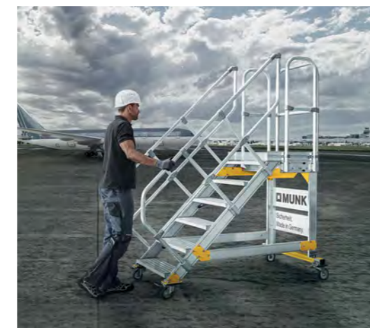
Mobile Plattfortreppen können bei Bedarf flexibel an unterschiedliche Einsatzorte bewegt werden.

Mit höchsten MUNK spezifischen Qualitätsstandards gefertigt, erfüllen unsere Produkte selbstverständlich nicht nur alle relevanten Normen und Vorschriften, sondern werden ausschließlich aus besten Materialien und in modernsten Produktionsverfahren gefertigt. Das gilt für unsere individuellen Sonderkonstruktionen ebenso, wie für jedes Produkt aus unserem über 2.500 Artikel umfassenden Standard-sortiment. Denn Menschen maximale Sicherheit im Arbeitsumfeld zu bieten, ist unser Ziel. Und das verwirklichen wir in jedem noch so kleinen Produktdetail.