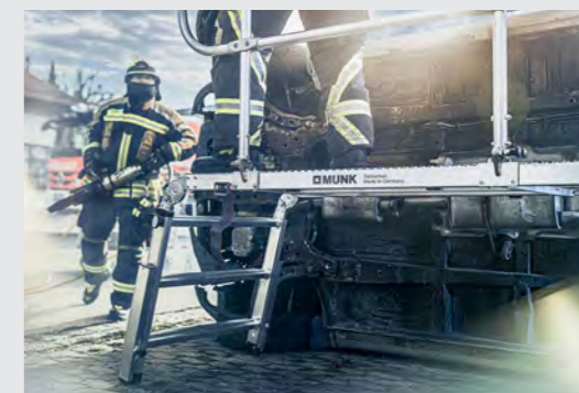
Innovative und intelligente Rettungsplattformen für maximale Sicherheit im Einsatz.

Sicherheit auf höchstem Niveau. Die MUNK Group zählt zu den führenden Premium-Anbietern von Leitern, Rollgerüsten, Sonderkonstruktionen und Rettungstechnik. Unsere Produkte made in Germany beweisen auch unter härtesten Einsatzbedingungen, was wir unter Qualität und Zuverlässigkeit verstehen. Kontinuierlich auf der Basis von langjährigem Praxiseinsatz optimiert und weiterentwickelt, machen sie uns zu dem was wir sind: Der Technologie- und Innovationsführer für Steigtechnik.